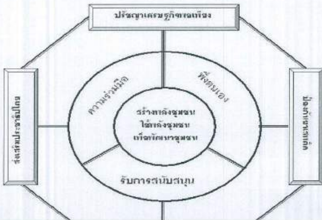
กรอบแนวคิดการจัดทำแผนสุขภาพชุมชนตำบลบ้านหัน

(๖) สนับสนุนและส่งเสริมการจัดบริการสาธารณสุข ( โครงการผ้าอ้อมผู้ใหญ่ แผนรองขับการขับถ่าย และผ้าอ้อมทางเลือก ) บุคคลที่มีภาวะพึ่งพิง และมีค่าคะแนนระดับความสามารถในการดำเนินกิจวัตรประจำวันตาม ดัชนีบาร์เธล เอดีแอล (Barthel ADL index) เท่ากับหรือน้อยกว่า ๖ คะแนน ตามแผนการดูแลรายบุคคลระยะยาว ด้านสาธารณสุข (Care Plan).